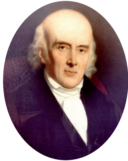
Samuel Hahnemann (1755-1843)

Ich bin zwar Homöopathin, doch keine Gärtnerin – deswegen eine Aufmunterung für alle zukünftigen „homöopathischen Gärtner(innen)“. Ich besitze einen Hausgarten und bin von Beruf weder Gärtnerin noch Botanikerin. Und vor 35 Jahren konnte ich kaum eine junge Kohlrabipflanze von einer Rose unterscheiden. Sie sehen, es ist noch kein „Meister vom